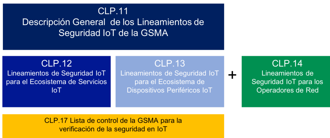
Figura 1 - Estructura del Conjunto de Documentos

A continuación, se muestra la estructura del conjunto de documentos de lineamientos de seguridad IoT de la GSMA. Se recomienda que el documento 'CLP.11 Descripción General de los lineamientos de Seguridad IoT de la GSMA' [1] se lea primero como base para entender los conceptos básicos antes de leer los otros documentos CLP.12 [2] y CLP.13 [3] (este documento).